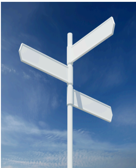
Samen maken we de club

Ben je nieuw op de club. Hieronder staan enkele tips. Zowel voor spelers als voor ouders.